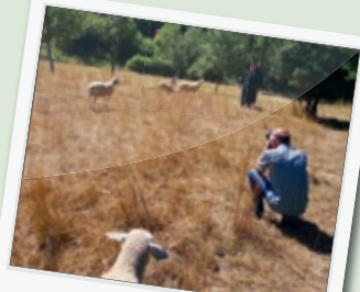
Making Of Booklet „De Mëllerdall - Eng Regioun mat Gout“