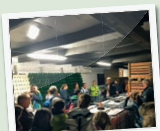
LINC 2019 in Estand