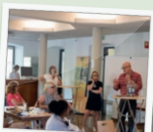
World Café in Larochette