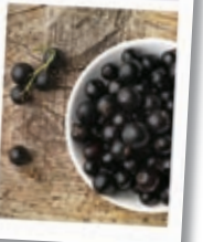
Geschenkkiste „Schwarz Kréischel's Allerlée“