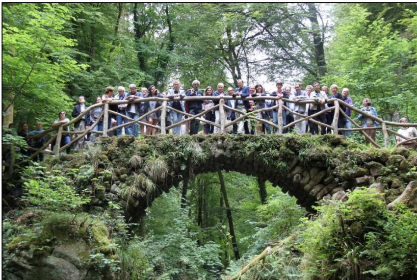
Foto: Exkursion in die Region Müllerthal – Kleine Luxemburger Schweiz am 14. Juli 2015