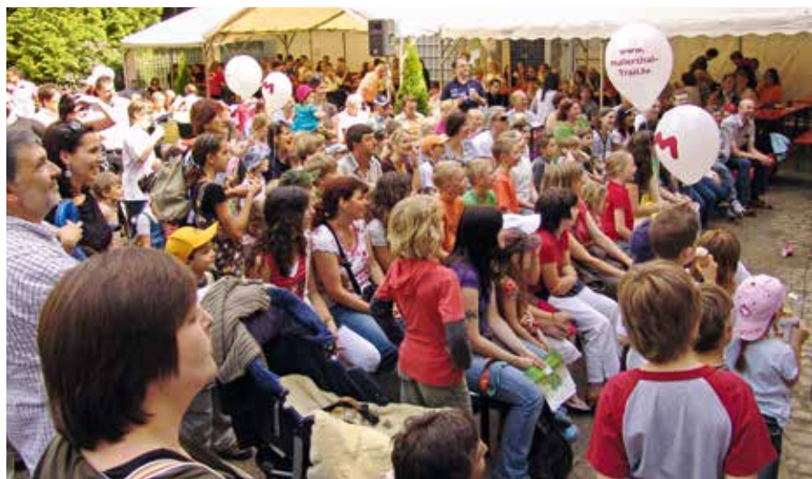
Mullerthal Trail Family Day 2010 in Beaufort