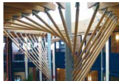
Spannende Architektur: die Dachkonstruktion des Prabeli (rechts)