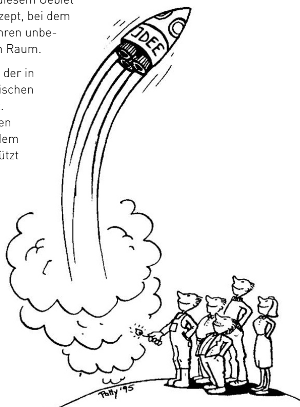
Mühevollle Kleinarbeit war vor allem während der ersten LEADER-Phase angesagt