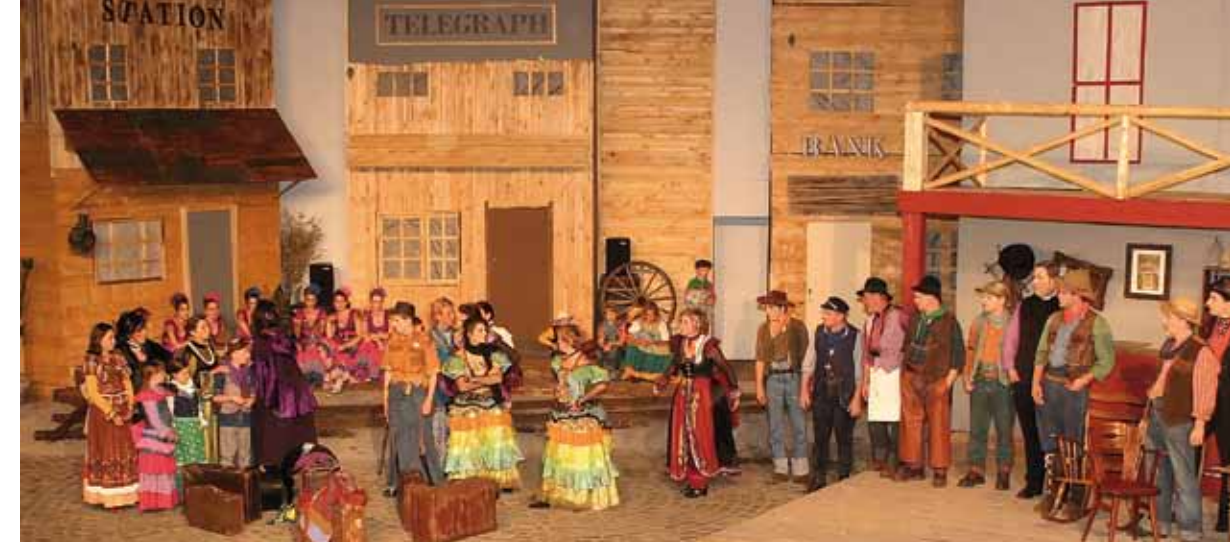
Spannendes Spektakel: Historisches Freilichttheater in Grosbous