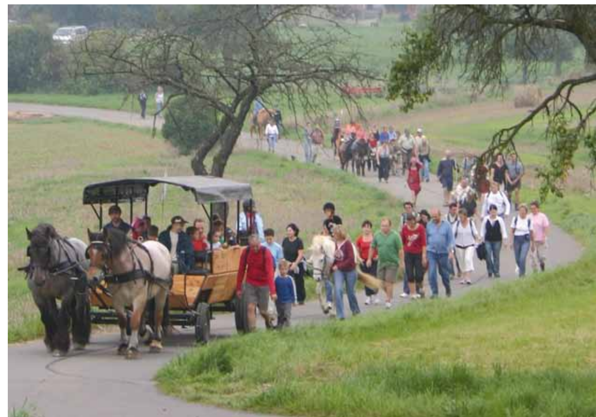
Wandern auf den Straßen der Römer, mit Kind und Kegel

Sicherlich gibt es auch andere historische Themen und Stätten, die sich auf vergleichbare Weise touristisch erschließen lassen würden, und Frau Kordel versichert, das übrige kulturelle Potenzial nicht außer Acht zu lassen. «Für uns ist das Thema Römer ungemein wichtig,» stellt sie jedoch klar, «nicht zuletzt, weil nachweislich die Römer den Weinbau bei uns eingeführt haben. 2.000 Jahre Weinkultur – damit können nur wenige Regionen aufwarten.» Ein Argument, das sich zugegebenermaßen auch über einen hohen Geräuschpegel hinwegsetzt.