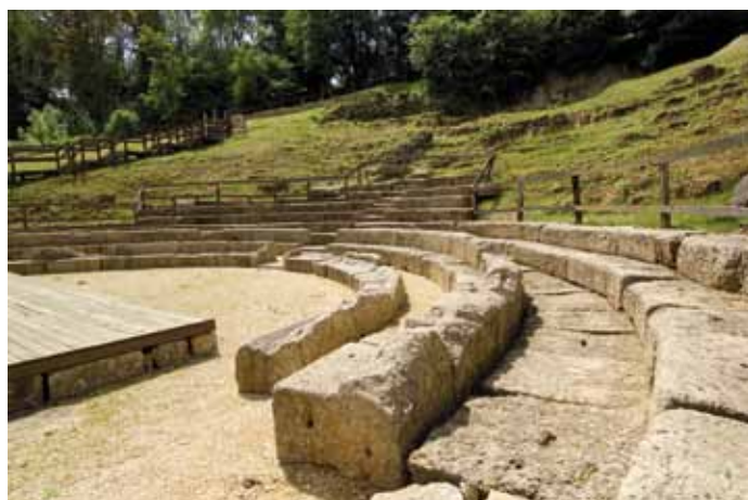
Das römische Theater in Dalheim