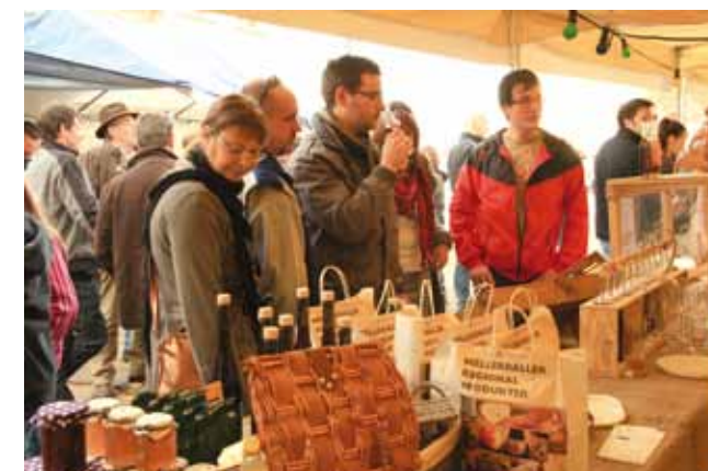
Haupteschfest in Berdorf: Stelldichein für Regionalproduzenten

Un service de médiation sociale a été installé par le MEC. Des personnes en conflit se rencontrent en présence de médiateurs afin de pouvoir discuter, échanger et trouver une solution à leurs problèmes. Numéro gratuit: 80023883 Permanences téléphoniques en présence d'un médiateur les mardis de 9h à 11h