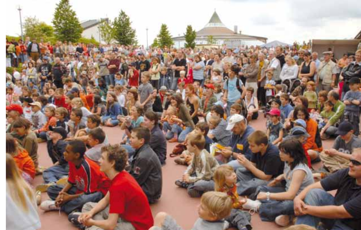
Organisée biannuellement par la Landakademie, implantée entretemps sur quatre régions LEADER, la fête de l'apprentissage attire des foules de visiteurs de tous les âges

et de collaborations tous azimuts. Contrairement aux syndicats intercommunaux, utiles mais souvent peu flexibles, la démarche LEADER est plus consensualiste, puisque les dossiers traités doivent faire l'unanimité pour connaître des suites.