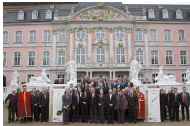
Lancement solennel du projet «Terroir Moselle» à Trèves