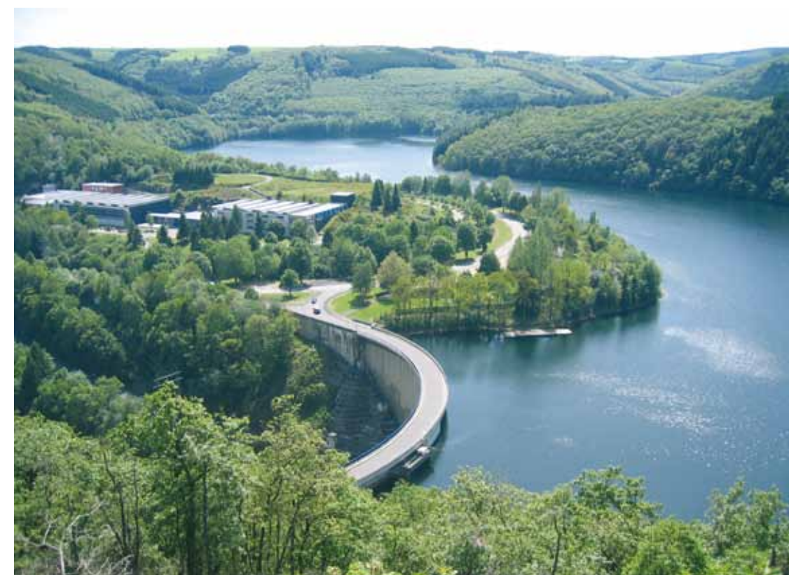
Le mur du barrage avec, à l'arrière-plan, les bâtiments du SEBES

On y travaille, la rassure Charles Pauly, le président.