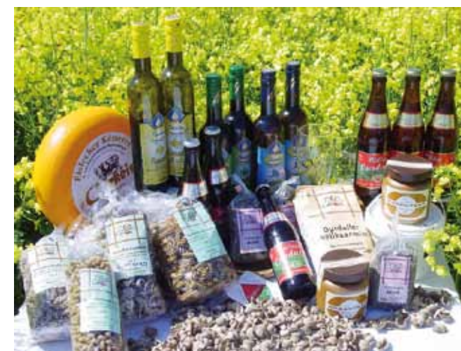
Ourdaller Gaumenfreuden: eine reichhaltige Produktpalette

Zugleich beabsichtigt die BEO eine Aufwertung des Berufsstandes Landwirt in der Gesellschaft einerseits durch eine transparente Produktion von Lebensmitteln, andererseits durch einen unmittelbaren Kontakt mit dem Endverbraucher.