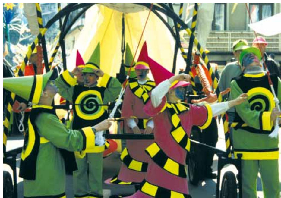
Vereinsleben: wer sich einbringen will, darf keine Arbeit scheuen