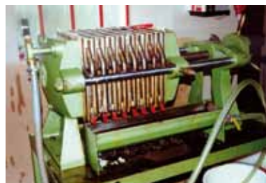
Die Ölpresse in Kalborn