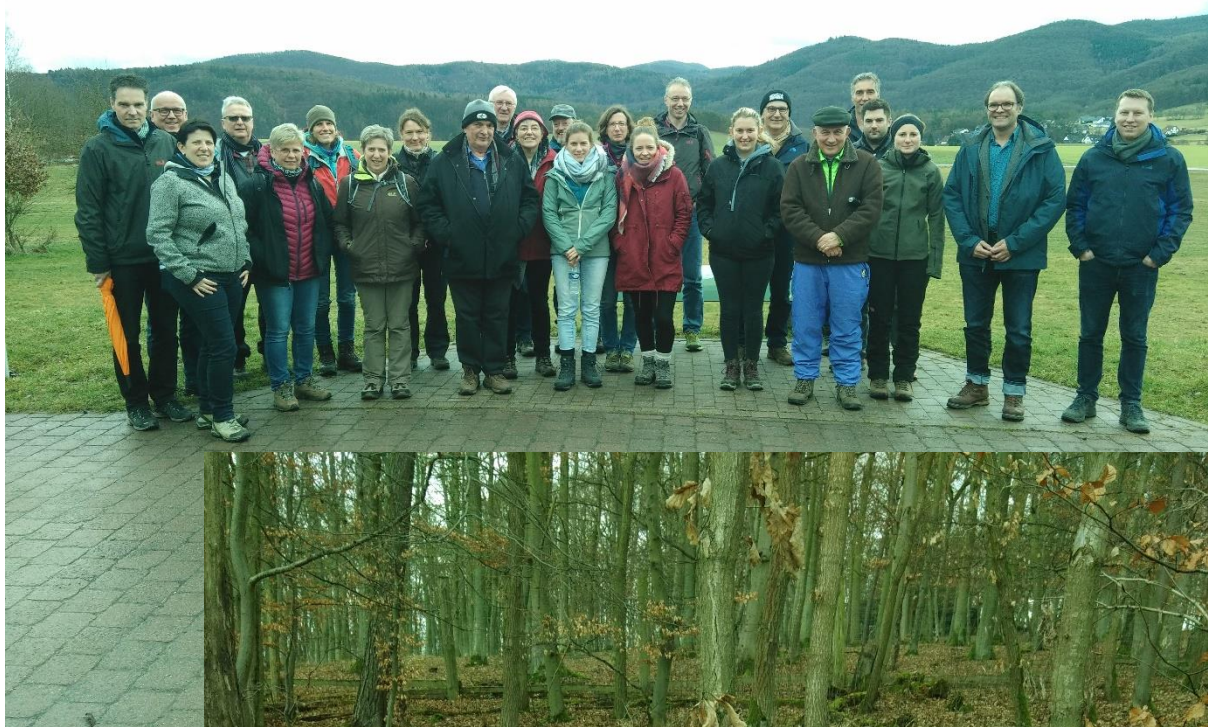
Die Teilnehmer-Gruppe beim Start der Begehung

- um die Kriterien des Deutschen Wanderverbandes zu erfüllen wurde extra parallel zu einem befestigten Waldweg auf 10 m Entfernung vom Waldweg ein Pfad im Wald angelegt auf etwa 2 km Länge).